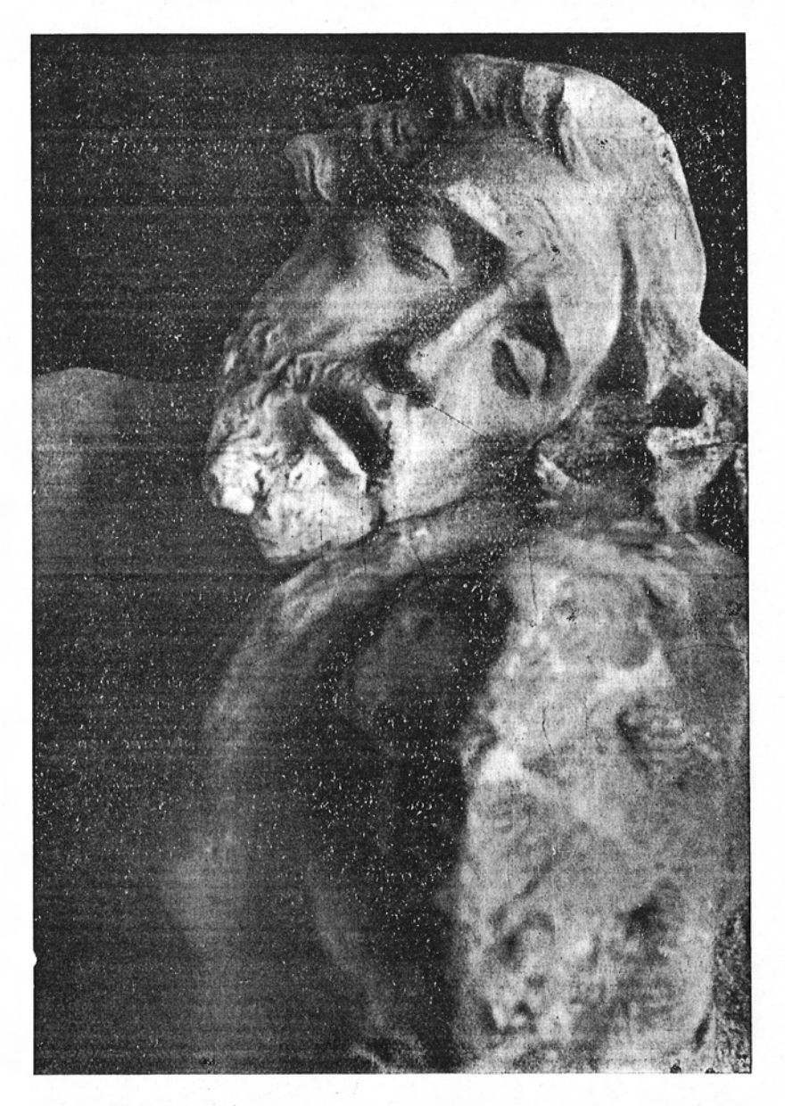
Semana Santa 1955