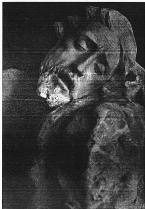
Semana Santa 1952